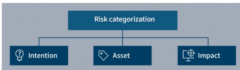
Abbildung 1: Risikokategorisierung

Die Aufgabe des IT-Administrators ist es sicherzustellen, dass die digitale Infrastruktur zuverlässige Produktivität ermöglicht. Vor diesem Hintergrund ist Sicherheitssoftware ein Mittel zum Zweck, aber keine endgültige Lösung. Der Administrator sollte die Risiken für die Infrastruktur kennen und die entsprechenden Lösungen aufspielen, um diese Risiken abzuwehren. Eine gute Möglichkeit, um einen Überblick über die Bedrohungen für digitale Geschäftsprozesse zu erhalten, ist, verschiedene Arten der Risikokategorisierung durchzuführen. Je nach Größe von Unternehmen und Infrastruktur kann und muss das Risikomanagement manchmal mittels eines Standardrahmens wie ISO 2700x, PCI DSS oder Common Criteria formalisiert werden. Auch wenn sie keine vollständige Sicherheits- und Risikomanagementstrategie ersetzen sollen, sind intentions-, element- und auswirkungsbasierte Ansätze ein Hilfsmittel, um Risiken aufzudecken und die Entwicklung angemessener Sicherheitskonzepte in die Wege zu leiten.